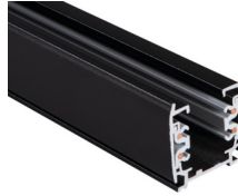
33231 TEAR N TR 1M-B

Elemento di sistema a sbarra, TEAR N TR 1M-B, sbarra collettore a 3 circuiti, nero, (33231)